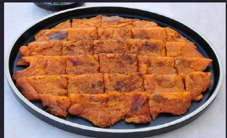
KIMCHI PANCAKE 김치전 $22