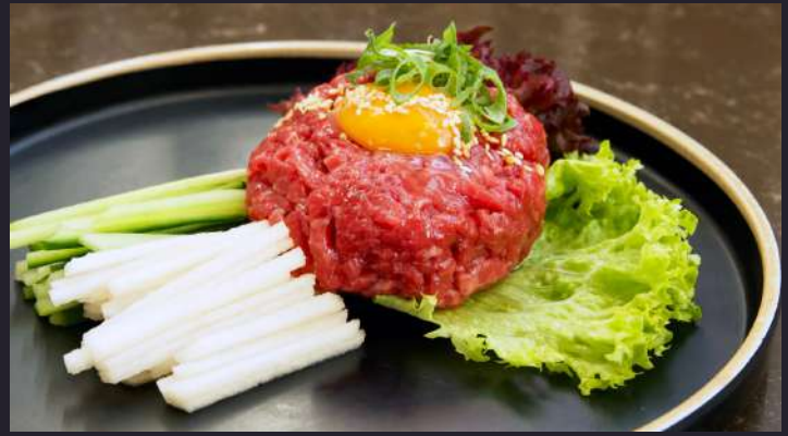
RAW BEEF TARTARE 육회 $32