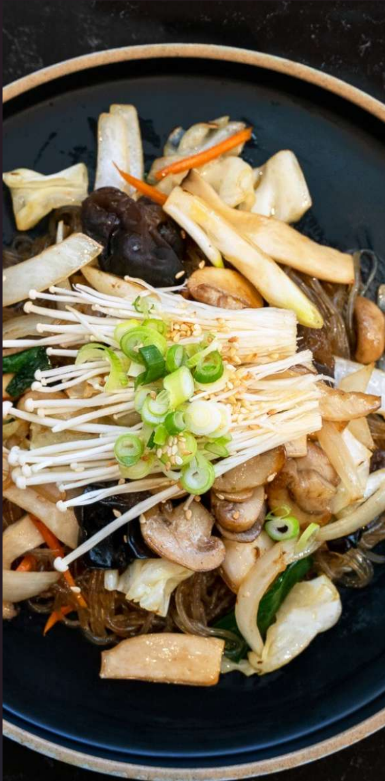
BEEF JAPCHAE 소고기잡채 $28 MUSHROOM JAPCHAE 버섯잡채 $26