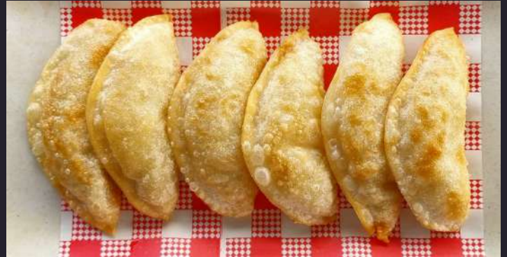
PORK DUMPLINGS 군만두 $15