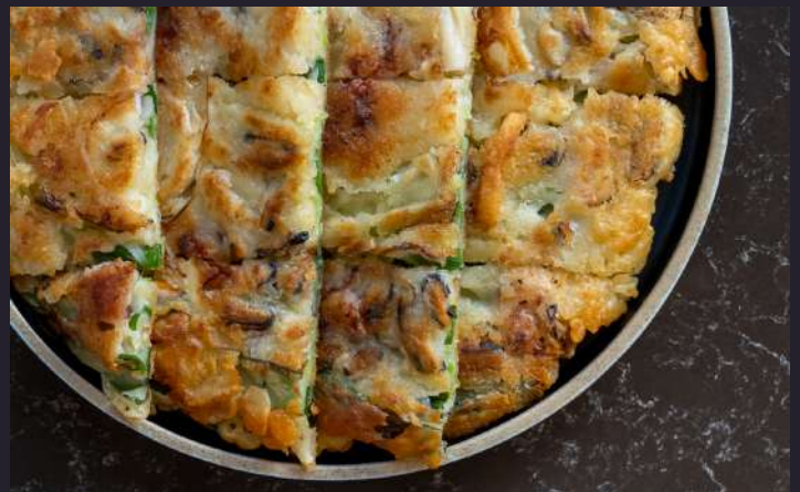
SEAFOOD PANCAKE 해물파전 $28